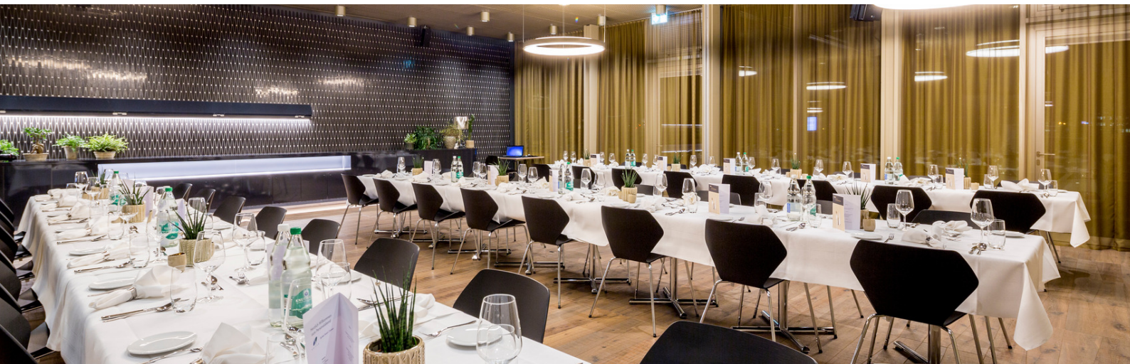
BANKETT 1 + 2