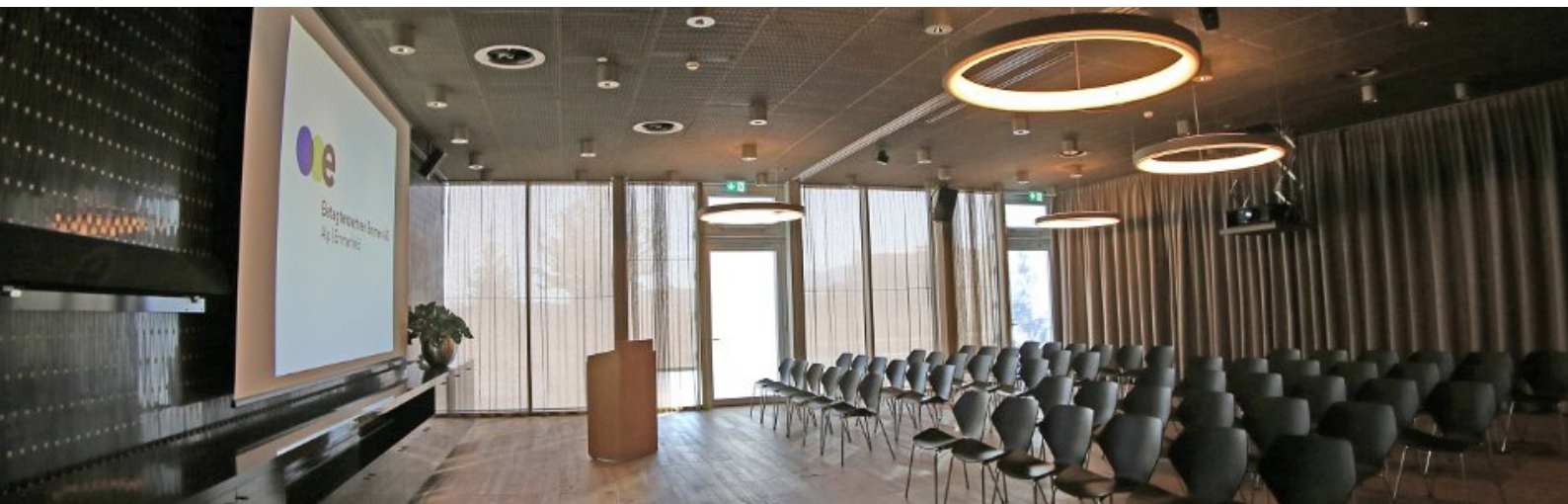
BANKETT 1 + 2