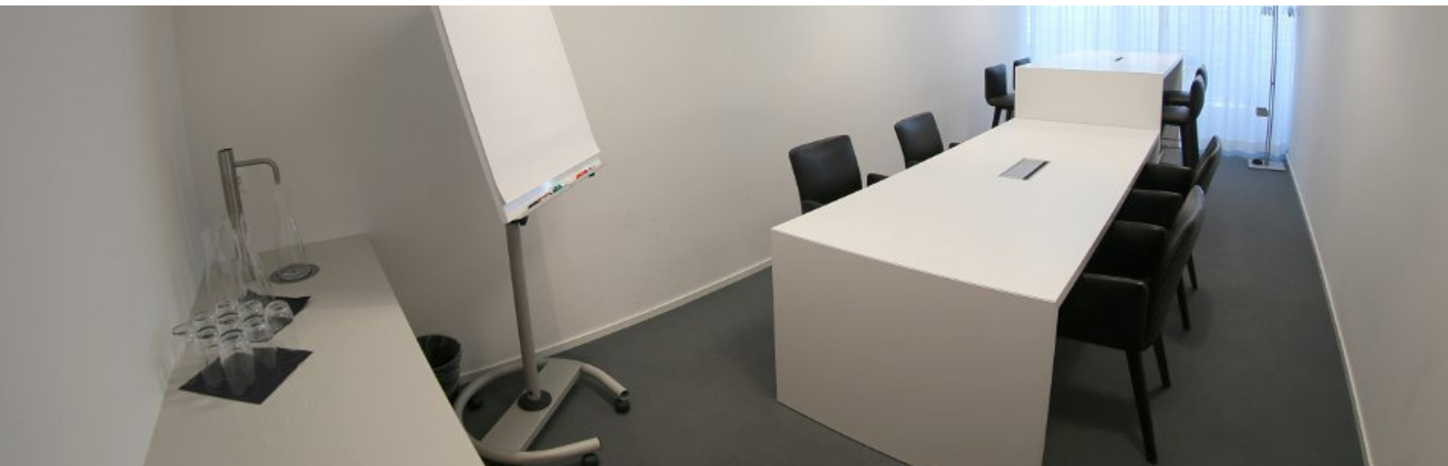
SITZUNGSZIMMER EG 1