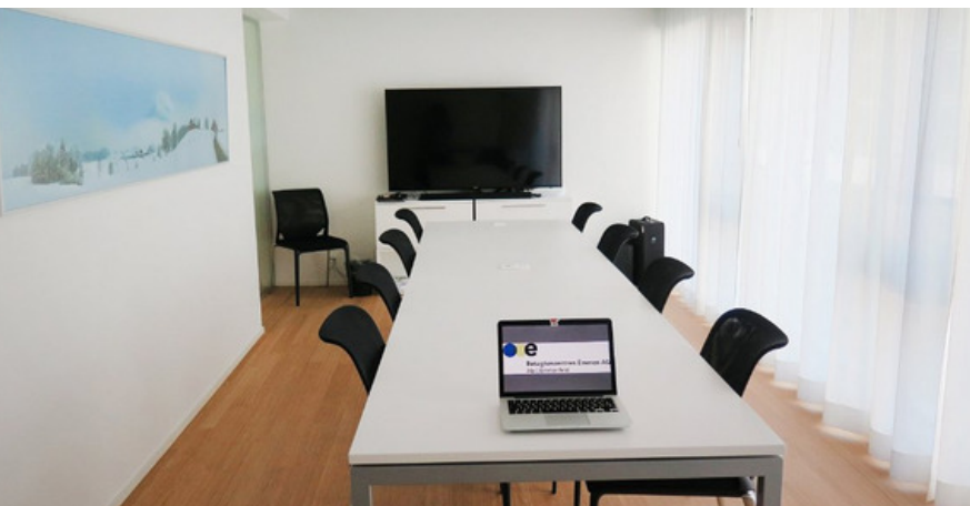
SITZUNGSZIMMER 1. OG

Wählen Sie zwischen unseren Seminarpauschalen «mini, midi oder maxi». Mehr Infos entnehmen Sie der Bankett und Catering Dokumentation.