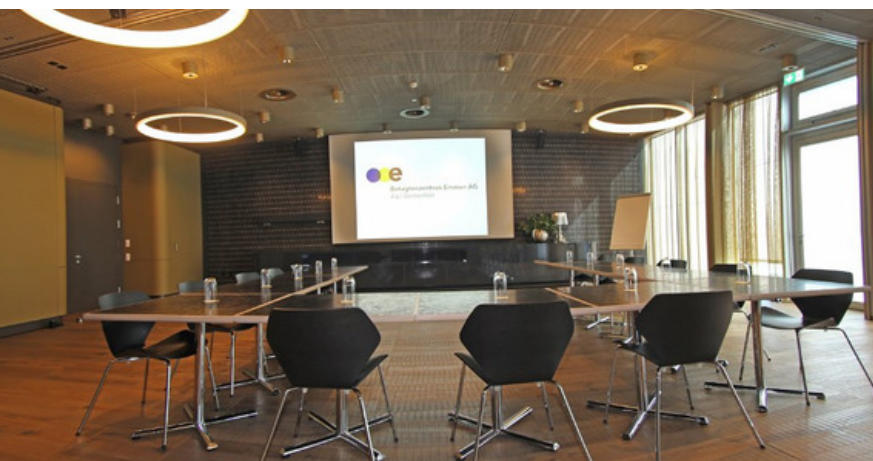
BANKETT 1 + 2

Profitieren Sie von unseren gratis Parkplätzen direkt vor dem Haus. Wenn Sie mit den Öffentlichen Verkehrsmittel reisen, können Sie bequem vor den Häusern aus- und einsteigen.